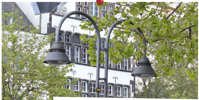
Produkt: V3781 Köln, Deutschland