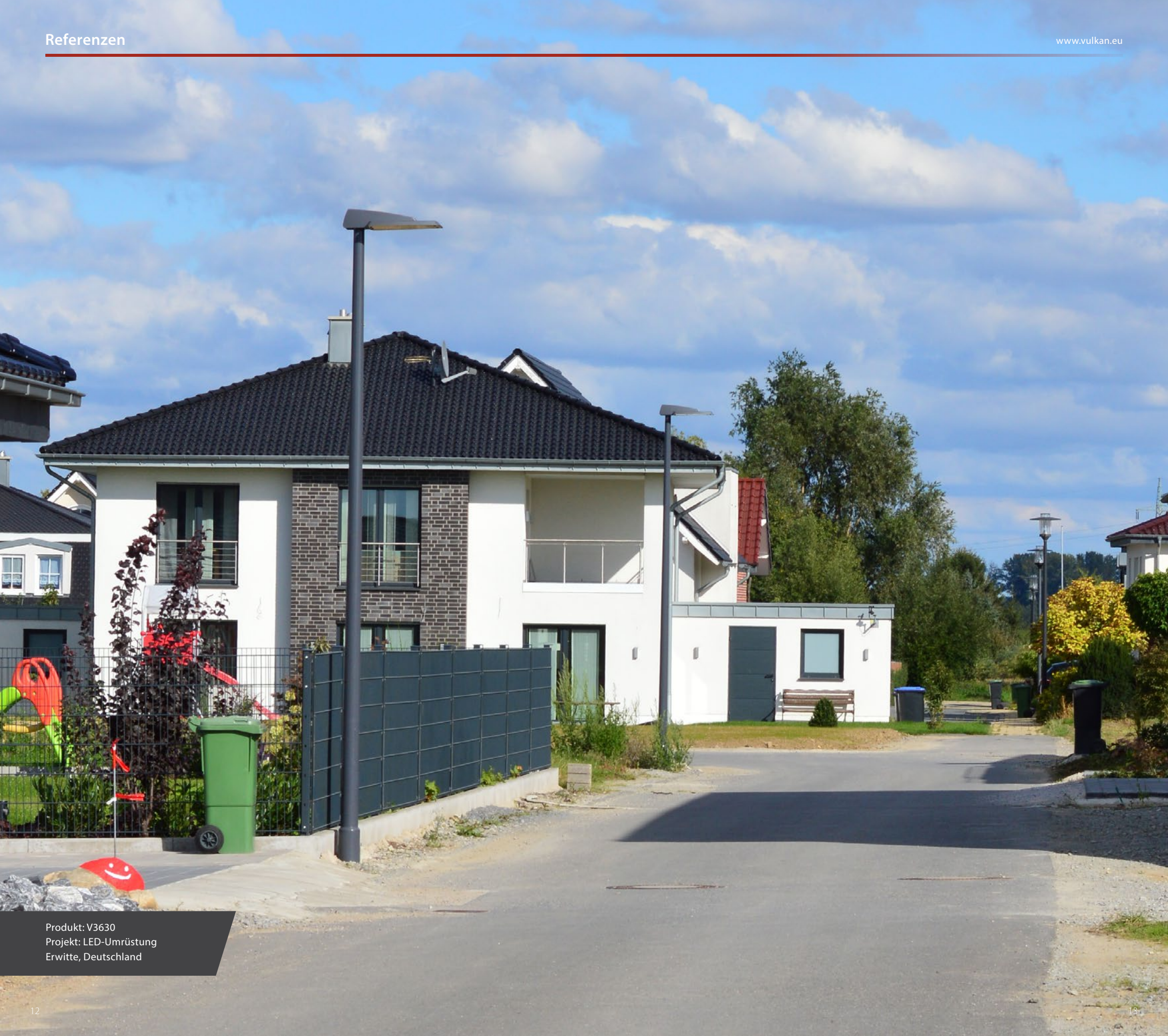
Produkt: V3630 Projekt: LED-Umrüstung Erwitte, Deutschland