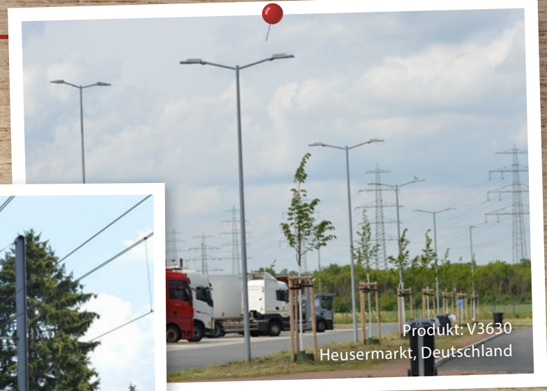
Produkt: V3630 Heusermarkt, Deutschland