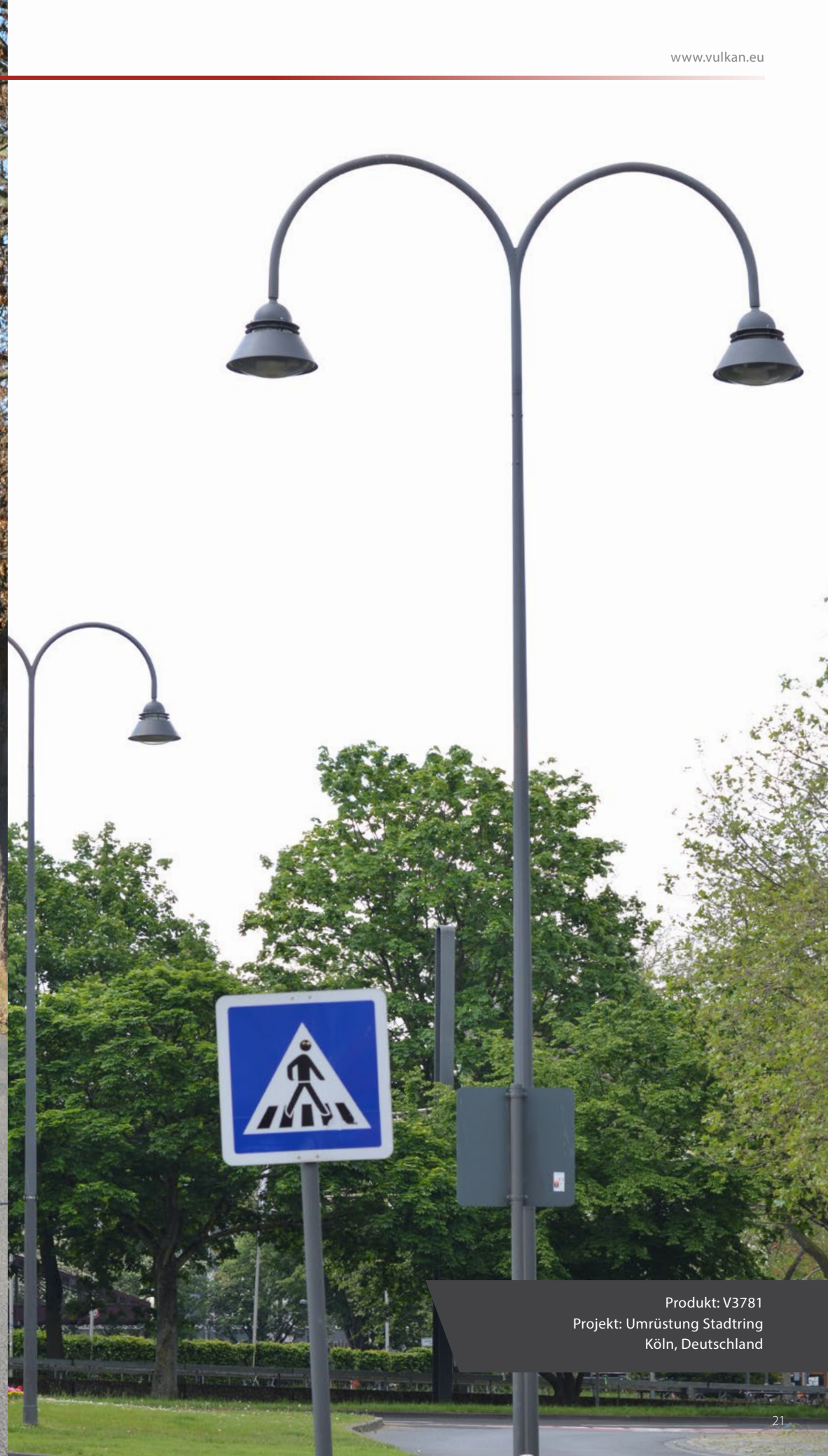
Produkt: V3781 Projekt: Umrüstung Stadtring Köln, Deutschland