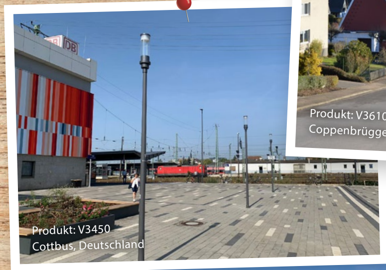
Produkt: V3450 Cottbus, Deutschland