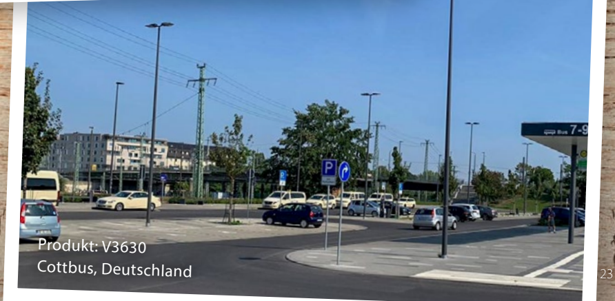
Produkt: V3630 Cottbus, Deutschland