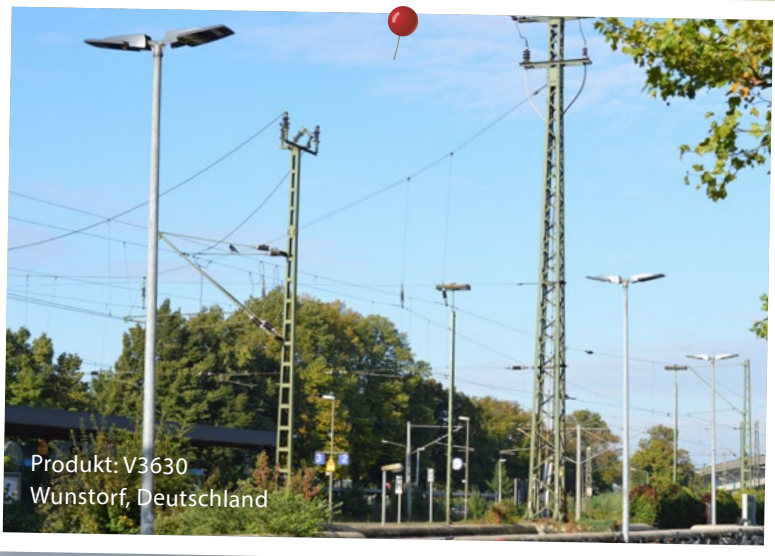
Produkt: V3630 Wünstorf, Deutschland