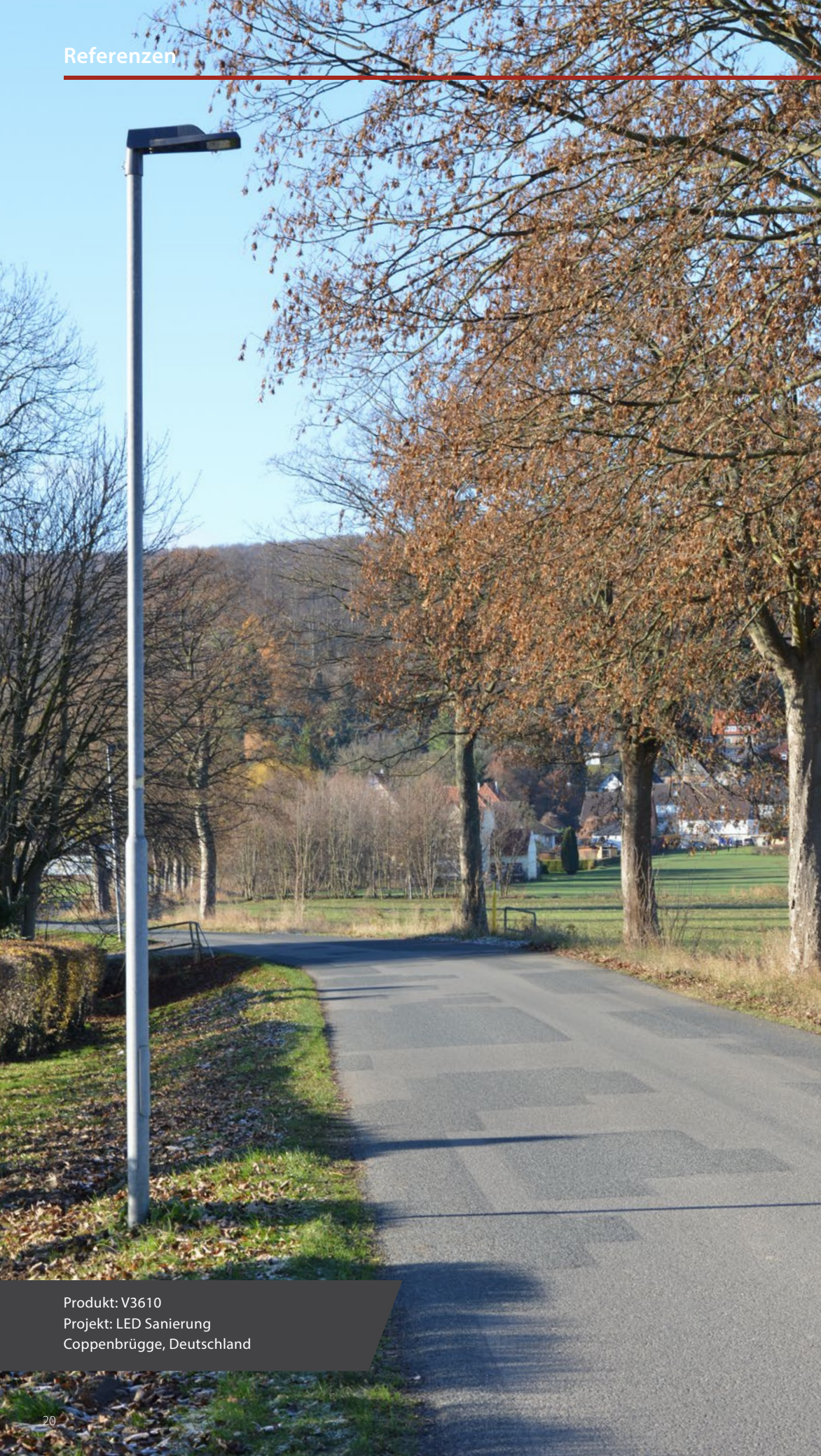
Produkt: V3610 Projekt: LED Sanierung Coppenbrügge, Deutschland