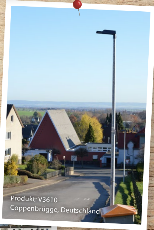
Produkt: V3610 Coppenbrügge, Deutschland