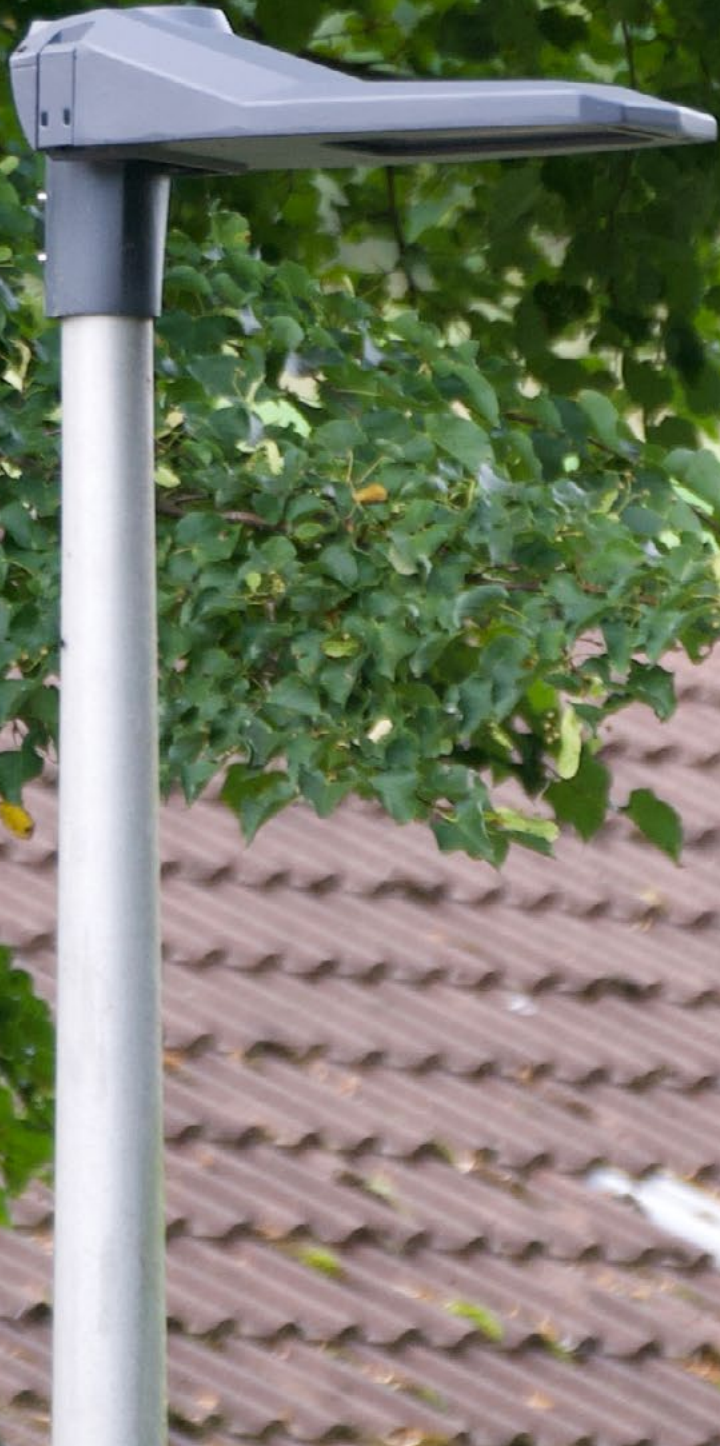
Produkt: V3080 Erzhausen, Deutschland