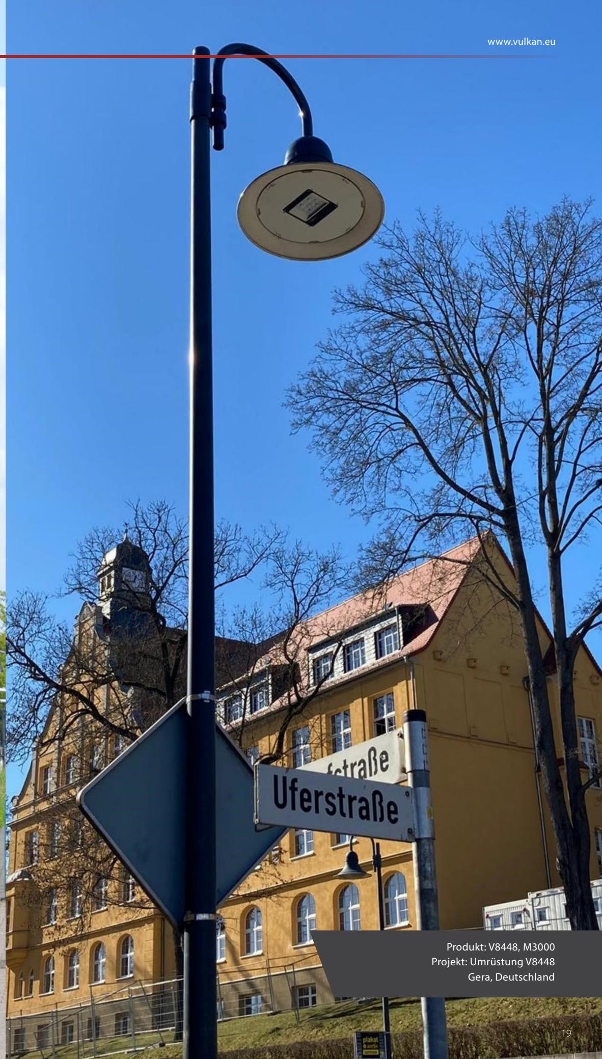
Produkt: V8448, M3000 Projekt: Umrüstung V8448 Gera, Deutschland