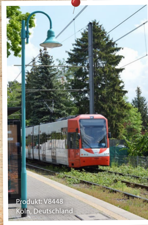
Produkt: V8448 Köln, Deutschland