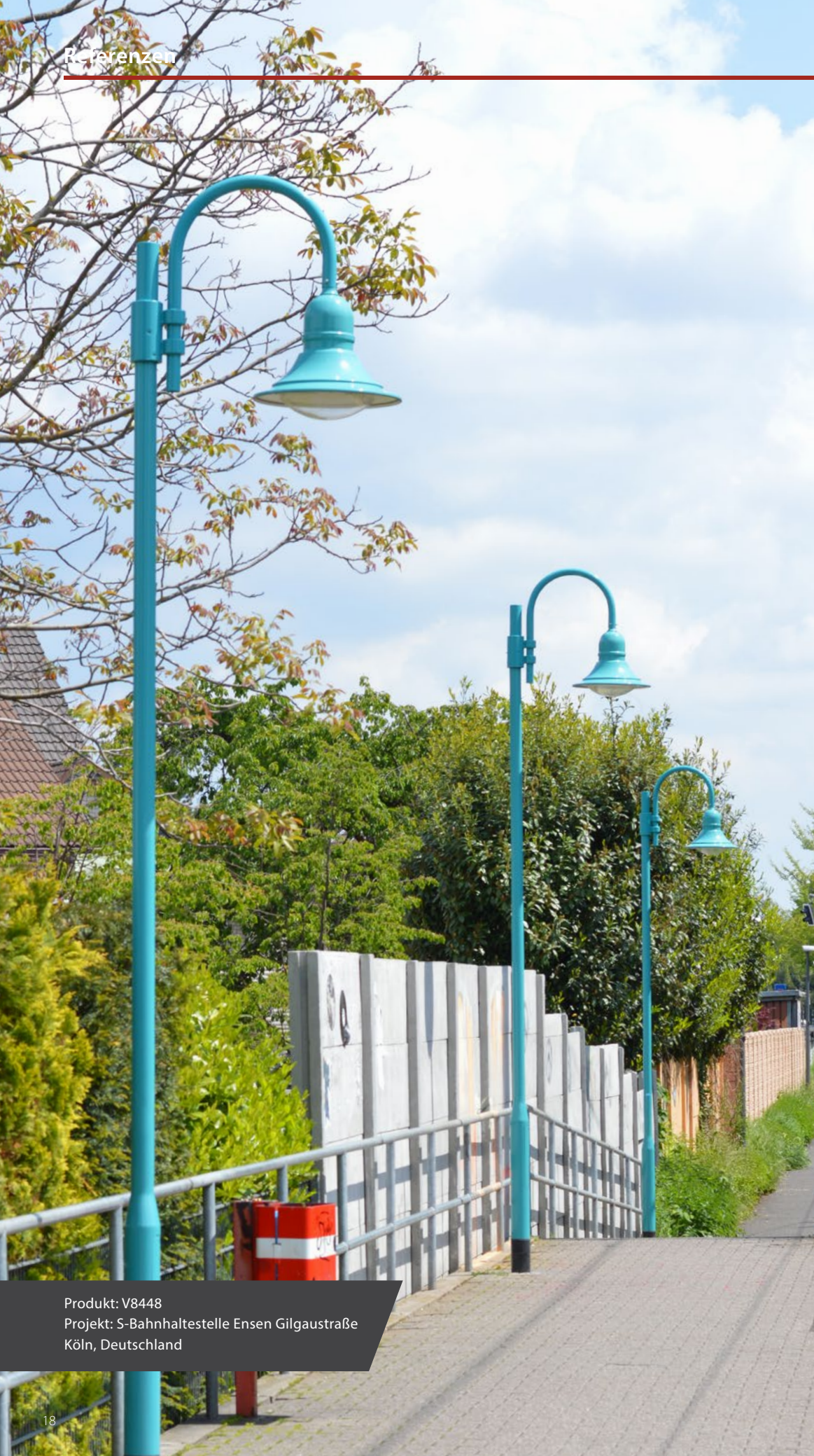
Produkt: V8448 Projekt: S-Bahnhaltestelle Ensen Gilgaustraße Köln, Deutschland